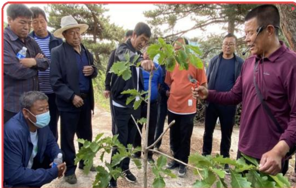
图 10 青龙县职业教育中心送教下乡讲授板栗裁剪