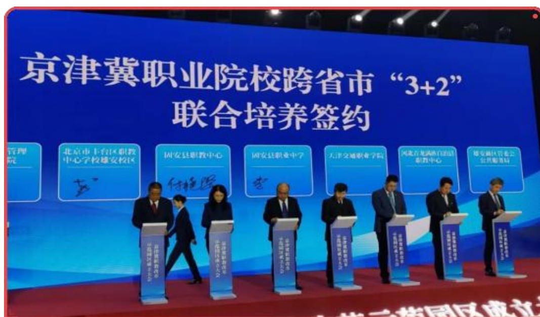
图 7 京津冀职业院校跨省市“3+2”签约现场

整合，并根据各自的专业优势，制定了详细的教学计划和人才培养方案，确保学生在不同阶段都能接受到高质量的教育和培训，为项目的成功推进提供了有力保障。经过不懈努力，青龙县职业教育中心圆满完成了 50 人的省批招生计划。两校的合作不仅实现了两地职业教育的优势互补、资源共享，还为京津冀地区职业教育的协同发展提供了新的思路和模式。通过项目的实施，两校在师资队伍建设、课程开发、实训基地建设等方面取得了显著成效，为其他地区职业教育的合作提供了有益借鉴。