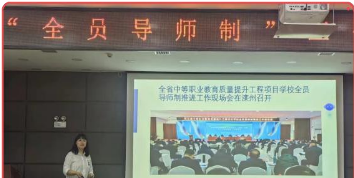
图 17 秦皇岛市卫生学校组织开展“全员导师制”专题培训