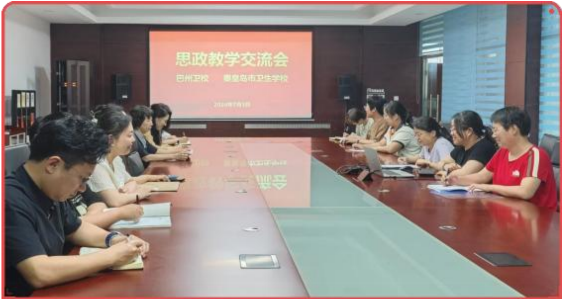
图 11 秦皇岛市卫生学校与新疆巴州卫校开展思政教学交流活动

生对思政课程的兴趣、如何把理论与实践相结合落实‘行走的思政课’”等方面进行了交流和分享。