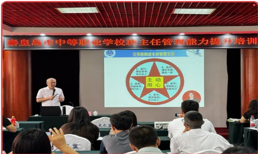
图 16 秦皇岛市中职学校班主任能力提升培训

考察观摩、开展技术实践和专业技能实训，组织教师到企业岗位等多种方式，培养教师实践能力和职业素养。