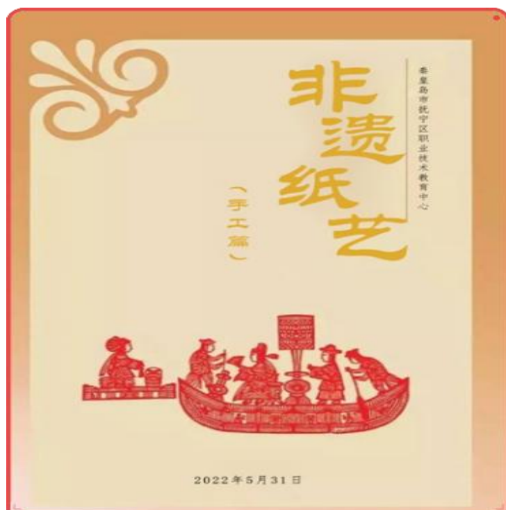
图 13 抚宁区职教中心非遗纸艺校本教材封面