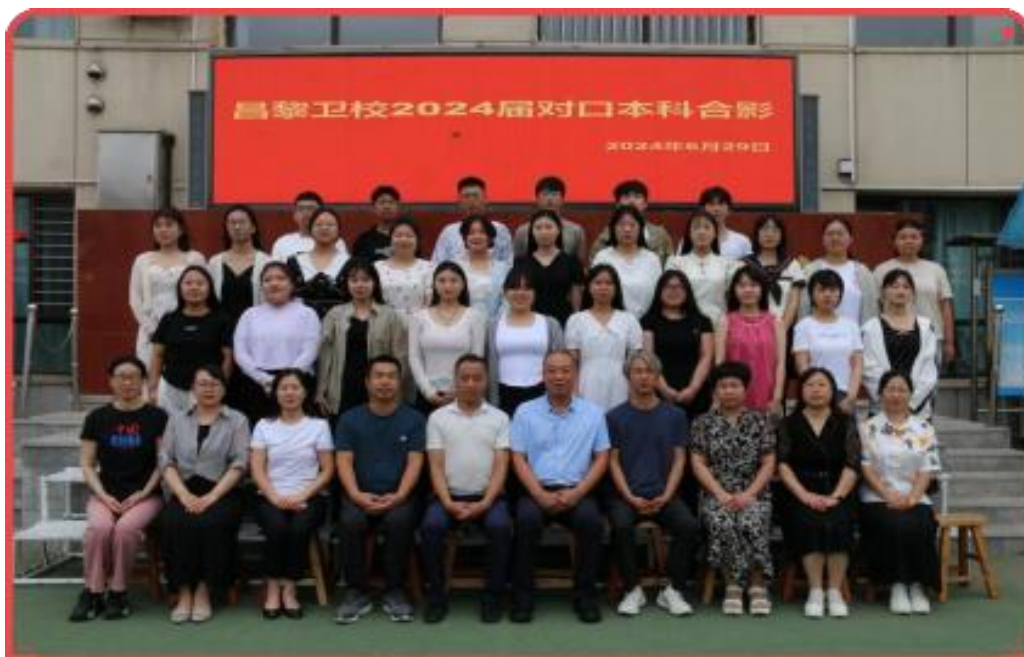
图6 昌黎卫校2024届对口高考本科学生合影

51人超过本科分数线，本科上线率33.33%；2024年，204人参加对口高考，89人成绩达到本科分数线，本科上线率43.6%，再次以优异的成绩向社会和家长交上了一份满意答卷。