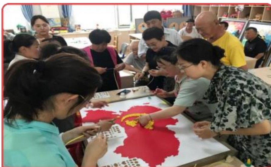
图 9 面向社区老年人开展手工制作课程

开拓老年教育服务社会领域。学校专门为老年人建设了乐为银龄教育实训基地，依托学校优秀师资力量开设朗诵、书画、舞蹈、养生、音乐等课程，在传统节日端午节开展“粽叶飘香，乐为相伴”联谊活动，扩大学校老年教育知名度，让更多老年人走进乐为银龄教育实训基地，推动学校老年教育服务功能进一步辐射周边社区，并尝试启动了“学校+社区”共享共建模式，开创银龄老年教育新格局。