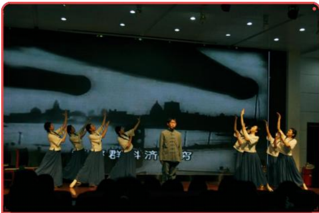
图 1 红色舞台剧《为中华民族伟大复兴而奋斗》剧照

态化的有效形式，不仅覆盖全校师生，更辐射至周边社区群众、结对共建高校、市报社小记者等团体组织，以创新方式开展思政教育，弘扬伟大建党精神，为强国建设、民族复兴提供精神力量。