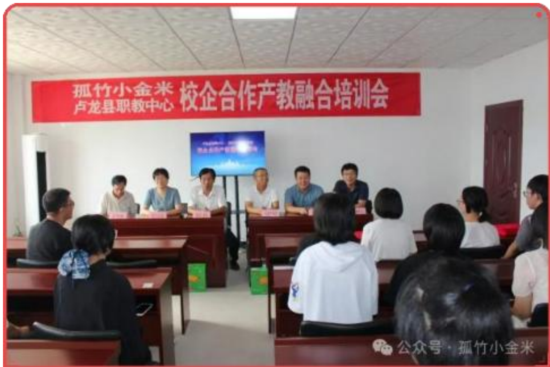
图 8 卢龙县职业教育中心与企业召开校企合作产教融合培训会