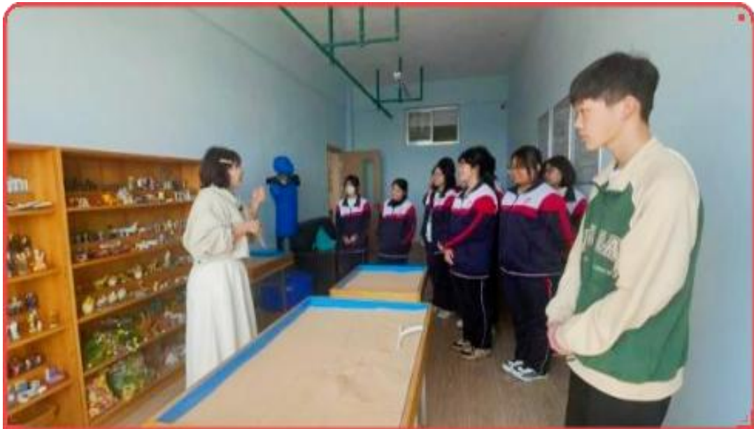
图 4 秦皇岛市职业技术学校组织学生心理沙盘游戏

谐发展，学校开展以“从心出发·筑梦远航”为主题的心理健康活动月暨沙盘游戏体验开放月。将心理健康教育贯穿学生教育全过程，培育学生热爱生活、珍视生命、自尊自信、理性平和、乐观向上的心理品质，支持学生成长为可堪大用、能担重任的时代新人。