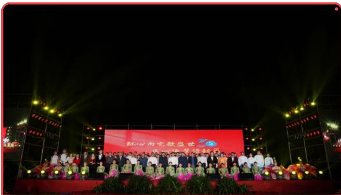
图 2 昌黎县职教中心“红心向党歌盛世 匠心逐梦谱新篇”活动

乘着党的二十大的东风，在强化特色上做文章，在内涵建设上下功夫，在提升水平上动脑筋，进一步提高教育教学质量，促进学校可持续发展。