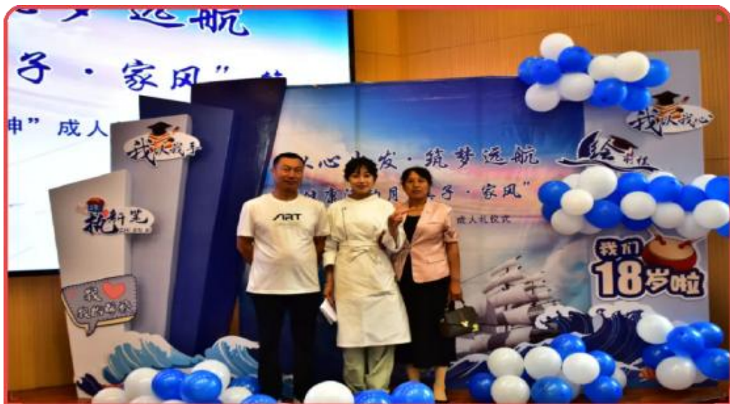
图 15 在职业教育活动周上毕业生与家长合影

秦皇岛市职业技术学校开启 2024 年职业教育活动周系列活动之“家长进校园”，家长参观校园环境、实训基地、食堂等设施，以座谈的形式就专业设置、师资队伍、技能培训、人才培养、就业前景、育人成果等情况进行分享与汇报。家长们纷纷表示，通过此次活动，对学校的教育质量和特色有了更加全面地了解，对孩子的未来也更加充满信心。此次“家长进校园”活动的成功举办，充分展现了学校在职业教育领域的优异成果。